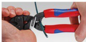
71 01/02/12 200 и 71 31/32 200